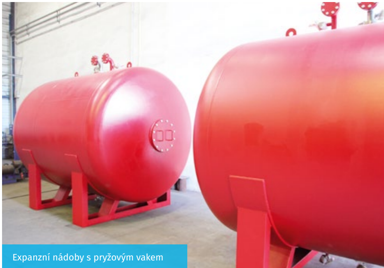
Expanzní nádoby s pryžovým vakem