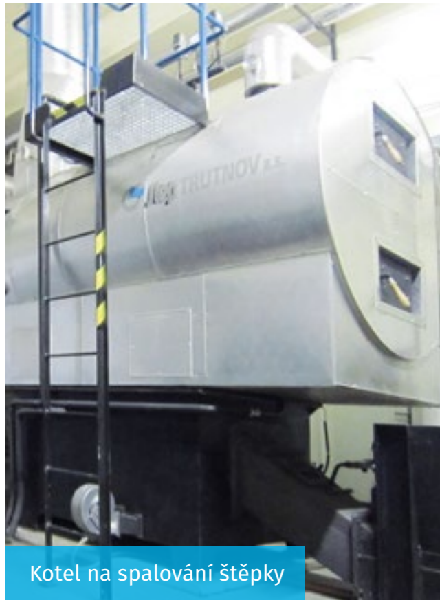
Kotel na spalování štěrky