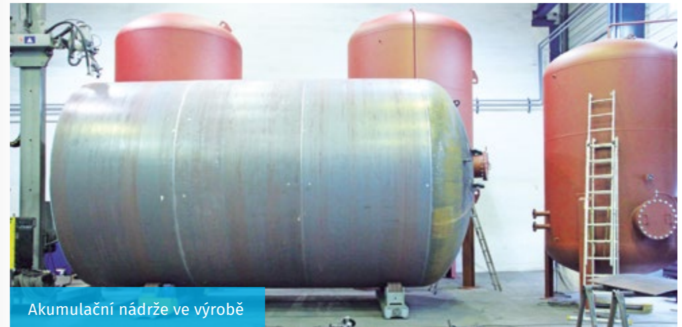
Akumulační nádrže ve výrobě