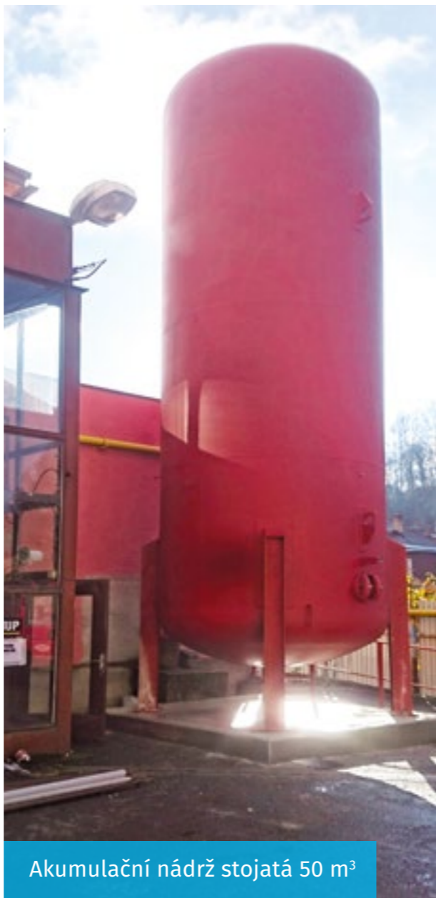
Akumulační nádrž stojatá 50 m 3