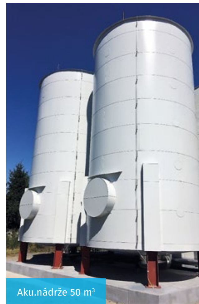
Aku.nádrže 50 m 3