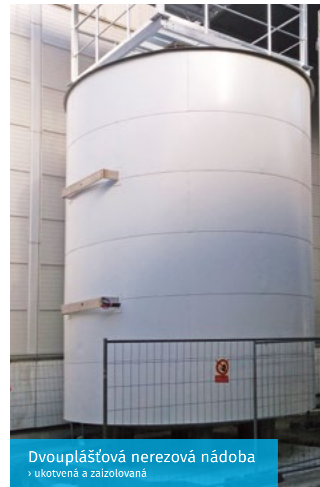
Dvouplášťová nerezová nádoba › ukotvená a zaizolovaná