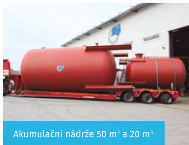
Akumulační nádrže 50 m 3 a 20 m 3