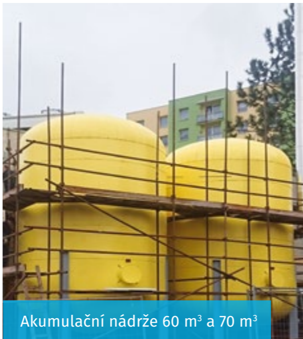
Akumulační nádrže 60 m 3 a 70 m 3