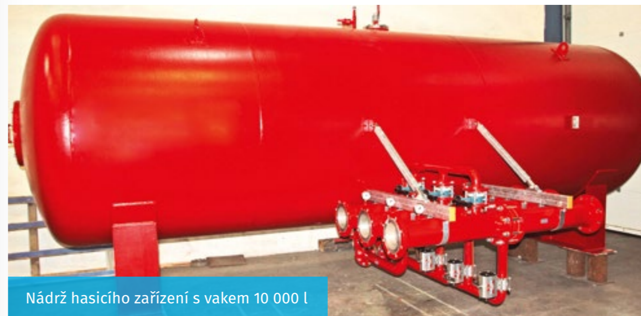
Nádrž hasičího zařízení s vakem 10 000 l