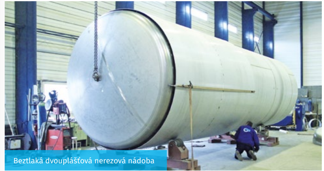
Beztlaká dvouplášťová nerezová nádoba