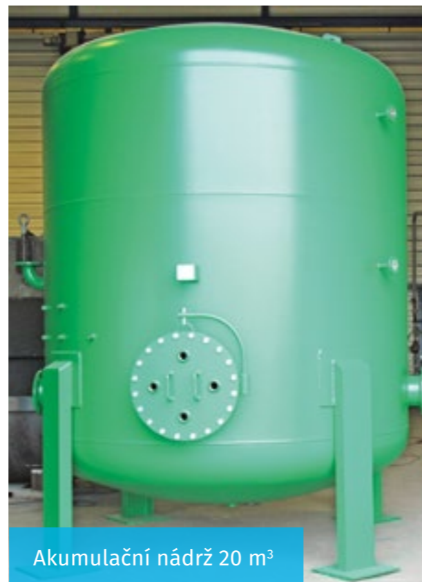
Akumulační nádrž 20 m 3