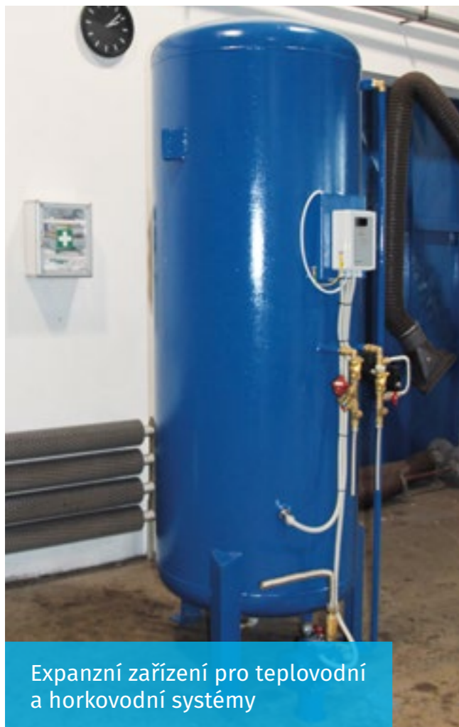
Expanzní zařízení pro teplovodní a horkovodní systémy