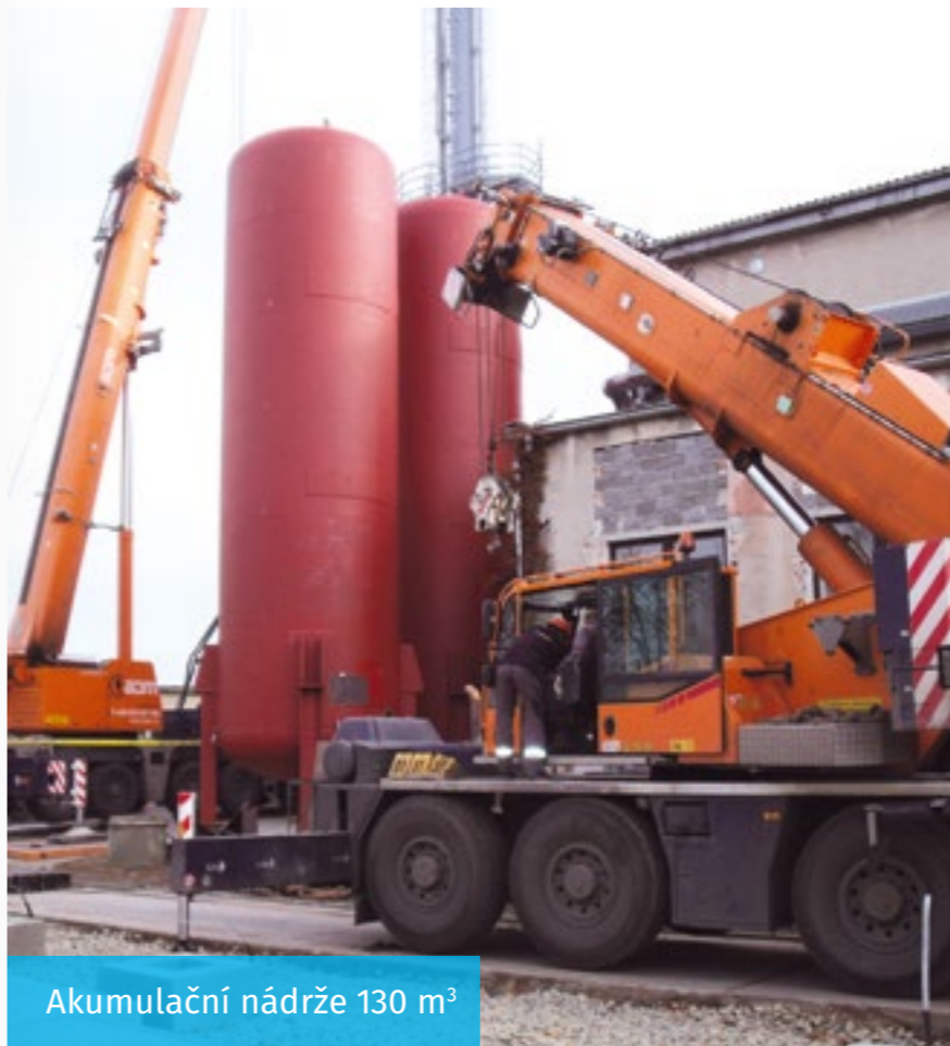
Akumulační nádrže 130 m 3