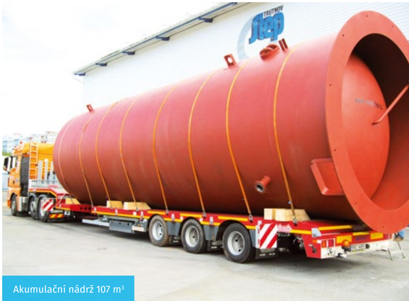
Akumulační nádrž 107 m 3