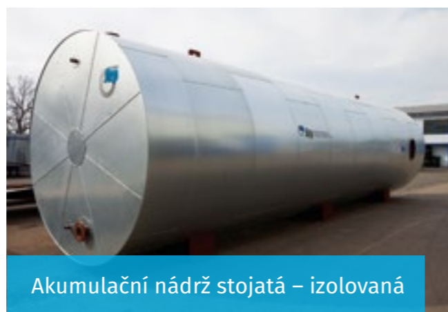
Akumulační nádrž stojatá – izolovaná