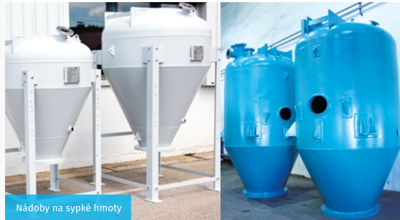
Nádoby na sypké hmoty