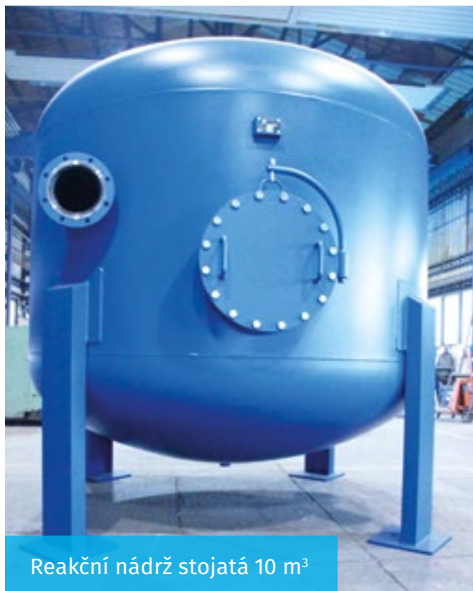
Reakční nádrž stojatá 10 m 3