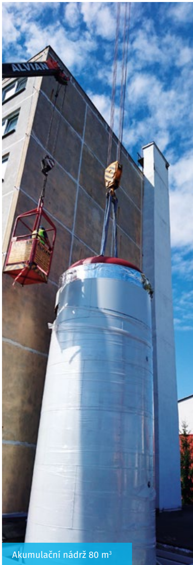
Akumulační nádrž 80 m 3