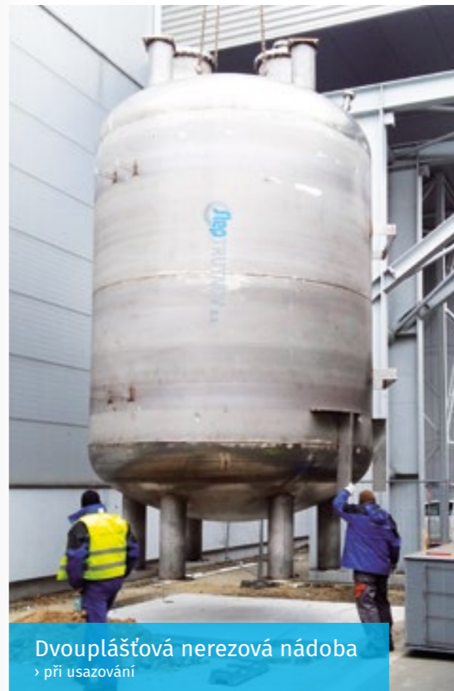
Dvouplášťová nerezová nádoba › při usazování