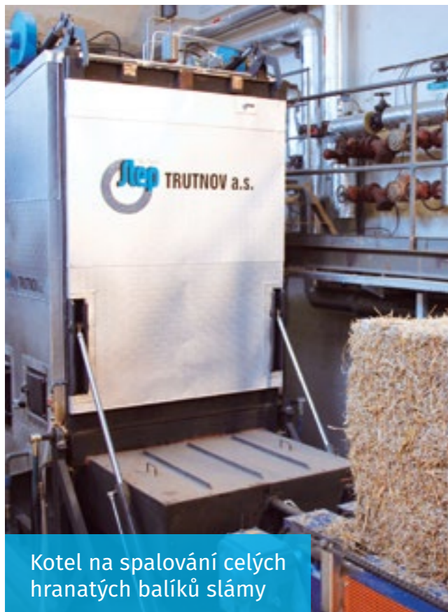
Kotel na spalování celých hranatých balíků slámy