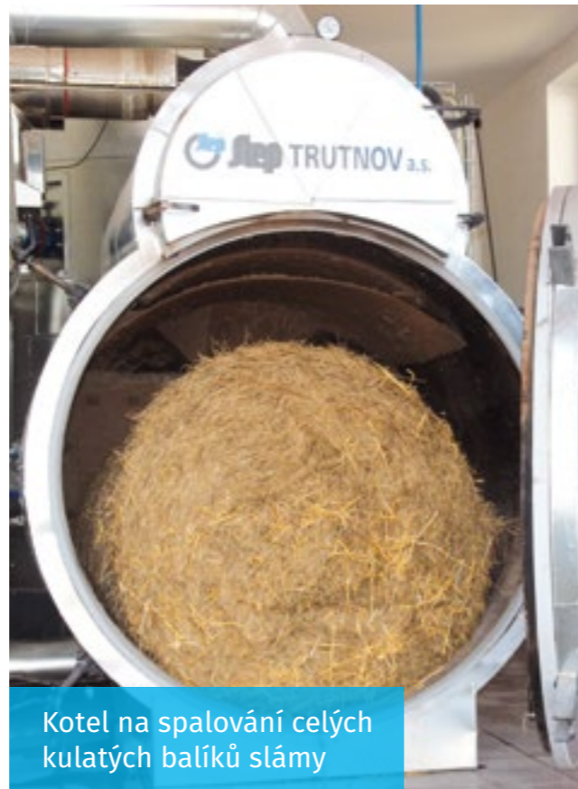
Kotel na spalování celých kulatých balíků slámy