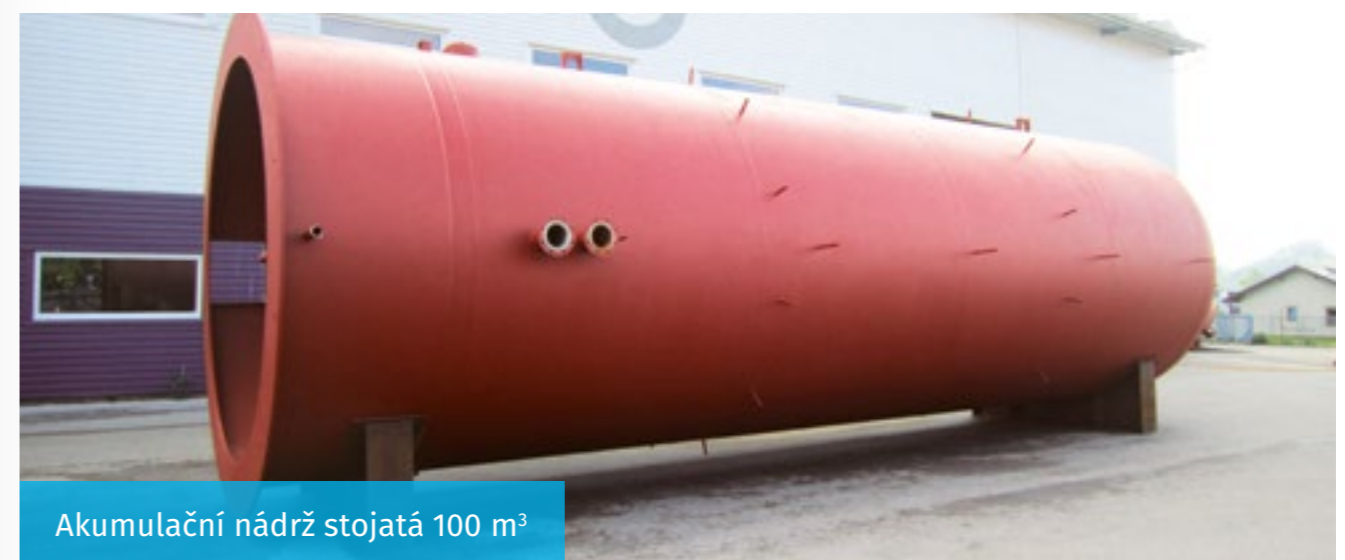
Akumulační nádrž stojatá 100 m 3