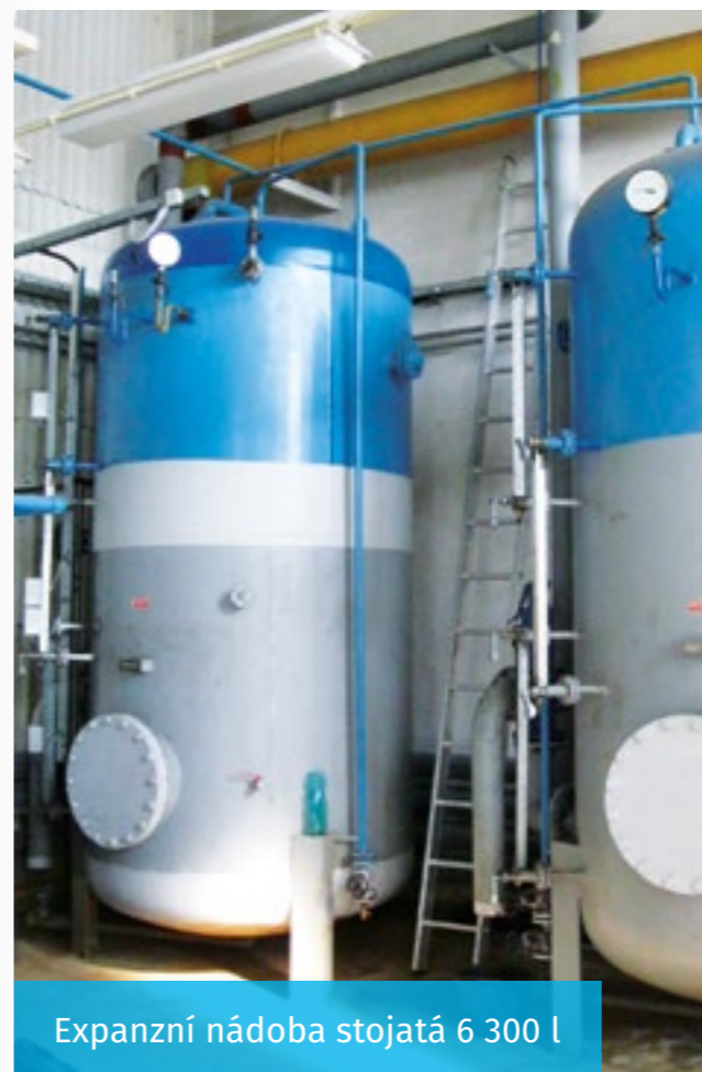
Expanzní nádoba stojatá 6 300 l