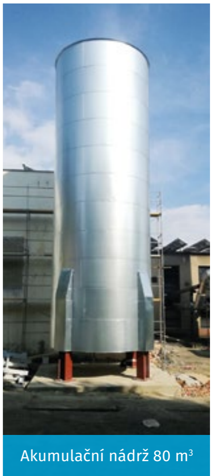
Akumulační nádrž 80 m 3