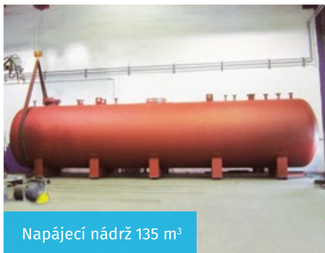
Napájecí nádrž 135 m 3