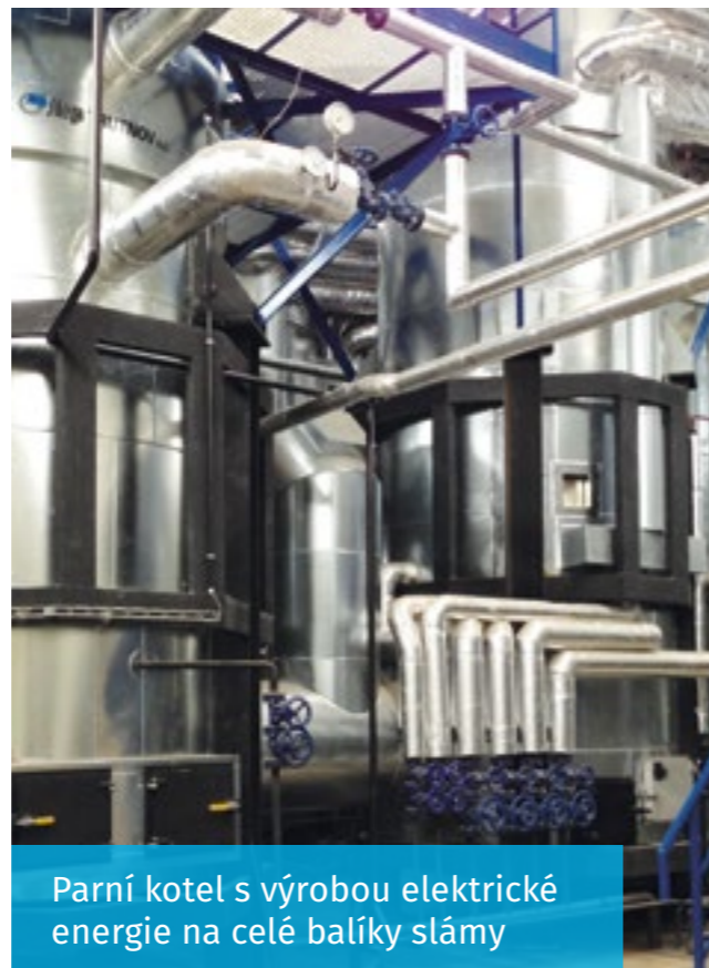
Parní kotel s výrobou elektrické energie na celé balíky slámy