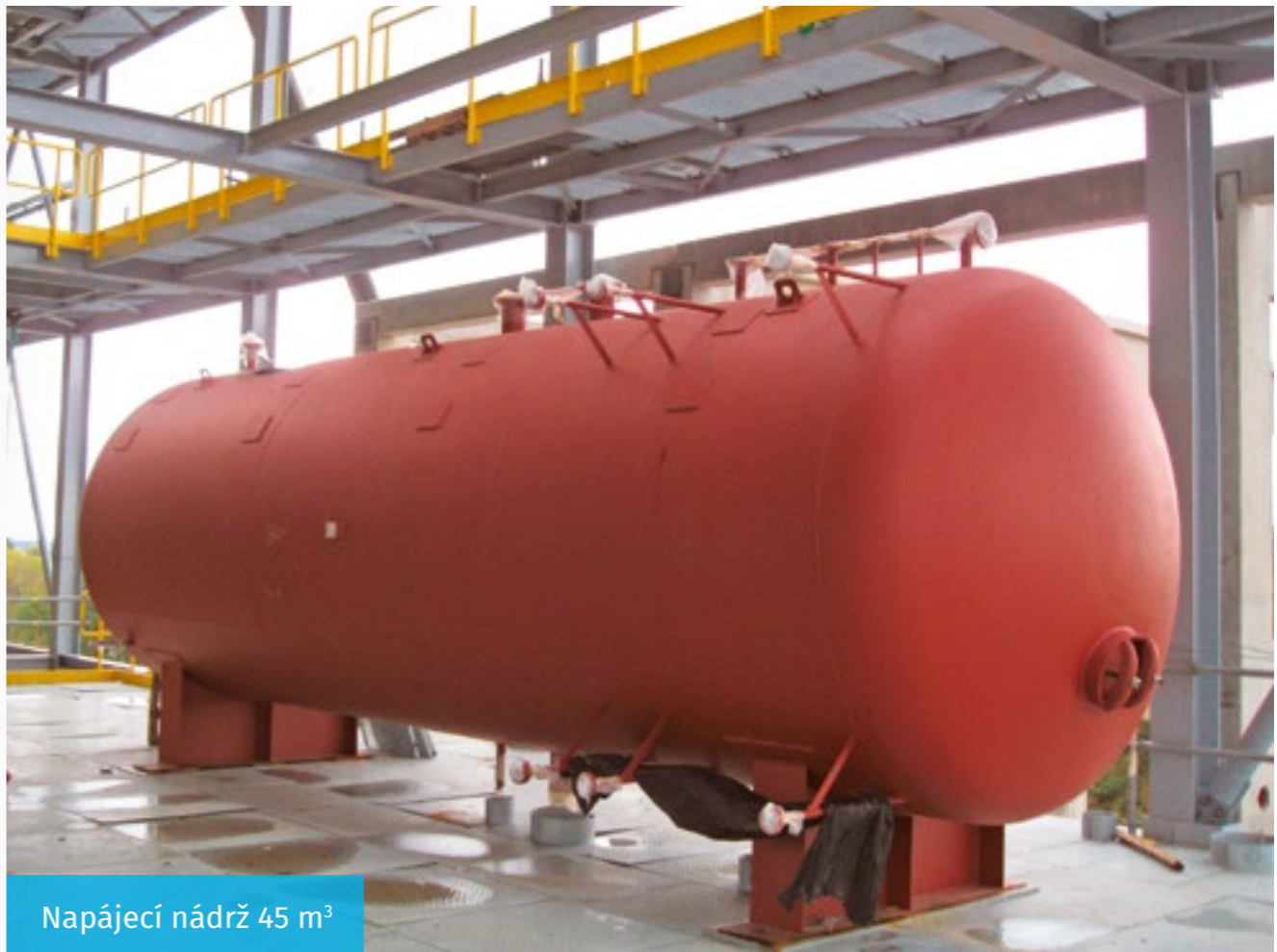
Napájecí nádrž 45 m 3